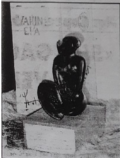
Un bronze magnifique.